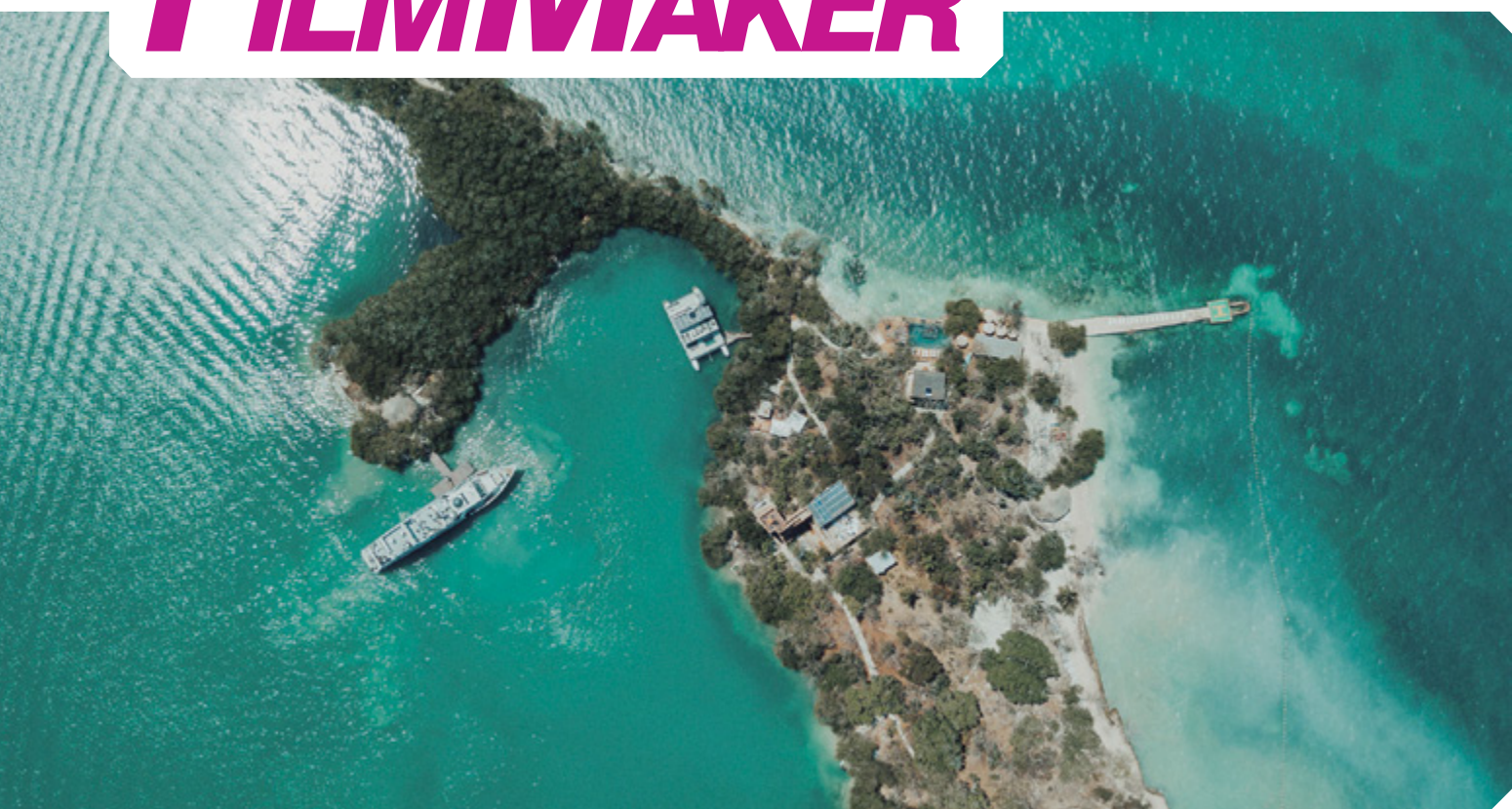
Imagem produzida com drone DJI Mavic Air para compor o vídeo de um casamento na Colômbia: variedade nos takes é marca de Coelho