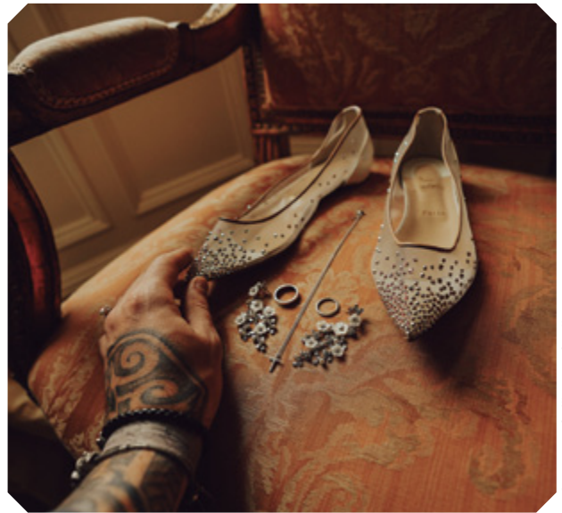
Imagens: Guilherme Coelho

Ao lado, noiva brasileira filmada no exterior; acima, making of de um take de detalhe filmado por Coelho