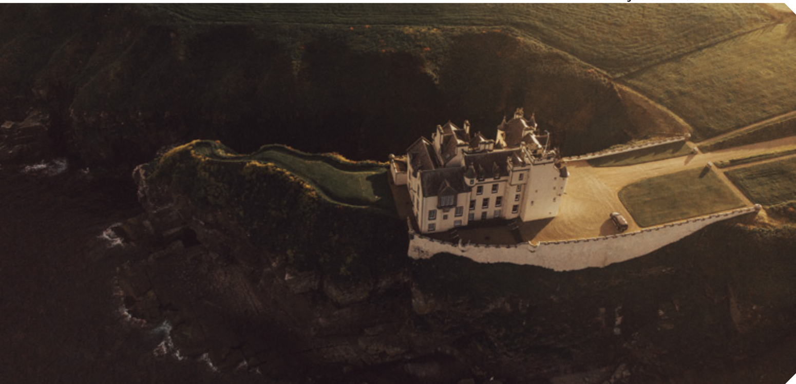
Acima, tomada feita com drone Mavic Air na Escócia e, abaixo, casal filmado na Praia de Lagoinha do Leste, em Floripa (SC)