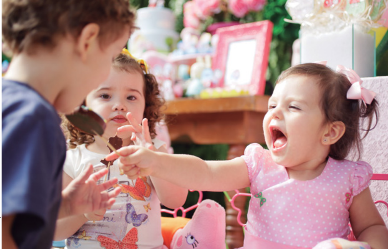
Registros da criança com os amigos é essencial (acima); para obter imagens espontâneas, o fotógrafo precisa ser aliado dela na hora da brincadeira (abaixo)

de. Evite pedir poses, apenas registre as atitudes naturais durante as brincadeiras, que se estendem durante quase toda a festa, dependendo da idade da criança. Normalmente, os pais ficam impressionados com essas imagens, pois na maioria das vezes estão entretidos com a recepção de convidados e não conseguem acompanhar esses momentos tão de perto quanto você.