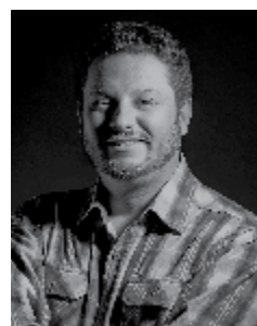
Richard Cheles Fotopublicidade