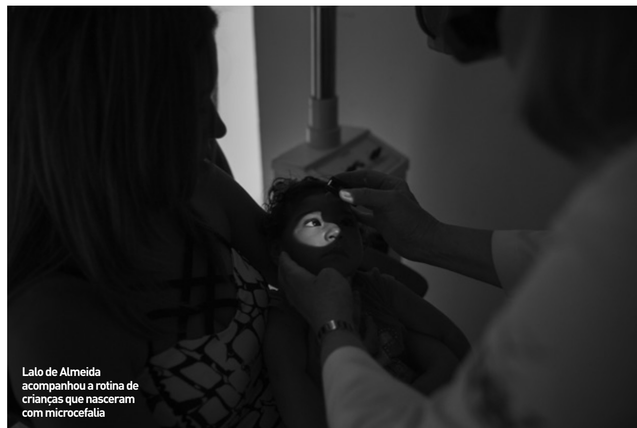
Lalo de Almeida acompanhou a rotina de crianças que nasceram com microcefalia